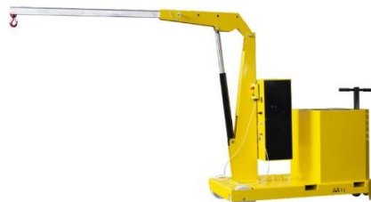
Model GZ1000B Model GZ1000BP