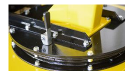
Mechanizm obrotowy z blokadą dla żurawi obrotowych