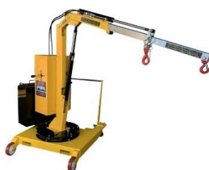
Modele 01B2SE i 01B5SE