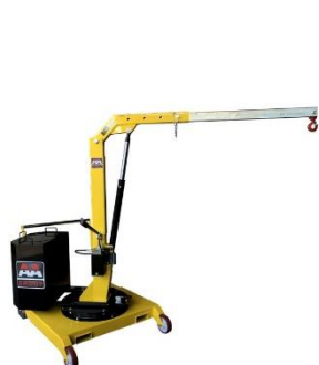
Modele 01M2 i 01M5