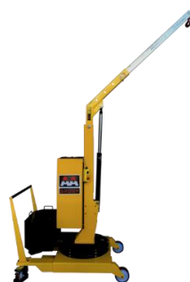
Modele 01B2 i 01B5 01B2P i 01B5P