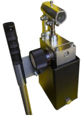
Podnoszenie ręczna pompa 01M2 i 5, GZ1000, 01M5RB